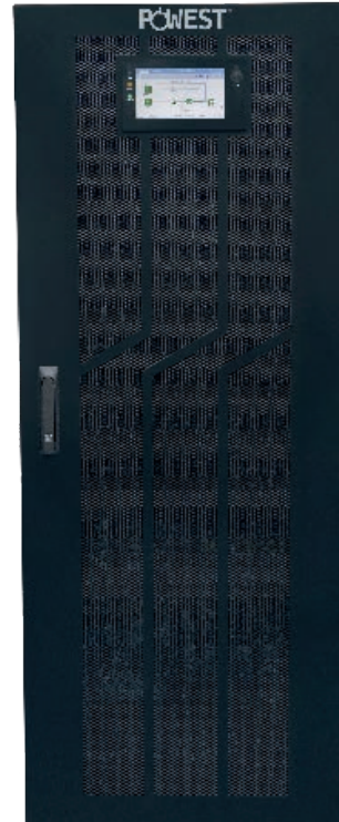
UPS POWEST HV 3300 60KVA a 200KVA