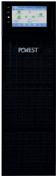
UPS POWEST EA9910 - EA9915 - EA9920