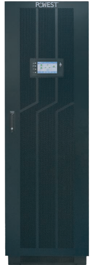
UPS POWEST HV 3300 250KVA a 300KVA